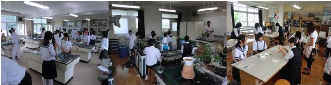
食品流通科 「我が家のケーキ屋さん」