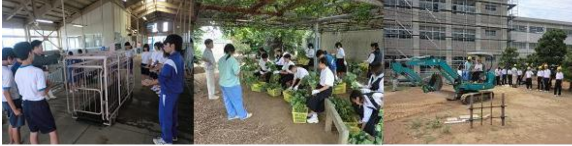
生物生産技術科 「動物を学ぼう」

7月20日(土)に第1回体験入学が行われ、たくさんの中学生と保護者に体験していただきました。高校選びのきっかけとなればいいですね。