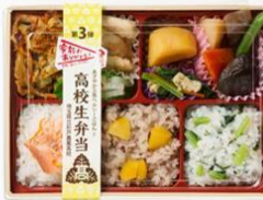
「三色ご飯のはいから弁当」